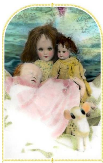
Figura 2. "Guagüita y sus muñecos", de la serie Recuérdame al morir con mi último latido, fotografía coloreada, 2010.