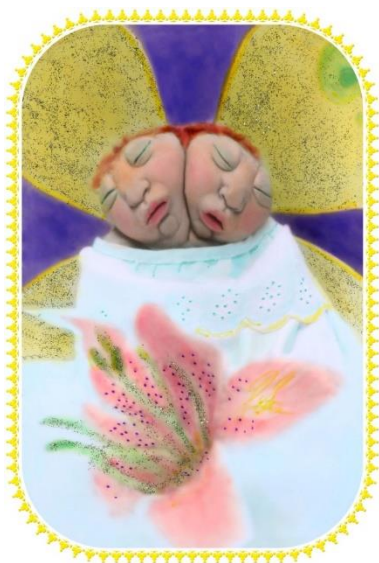
Figura 14. Zaida González, de la serie Conservatorio celestial, fotografía coloreada, 2004.