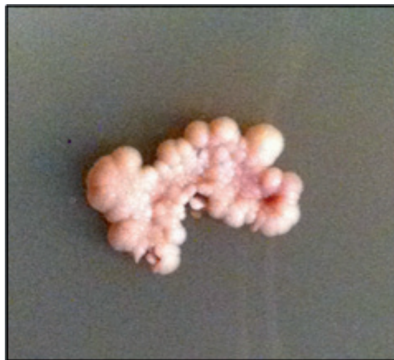
Imagen N°3. Colonia levaduriforme en CHROM-agar Malassezia .

CHROMagar Malassezia : de las colonias obtenidas en agar Sabouraud se realizó una suspensión a concentración 1 McFarland en 1 ml de suero fisiológico para ser sembrado por estrías en un medio cromogénico (CHROMagar Candida 56g; Tween 40 10ml; agar 8g/1Lt agua destilada). Estas fueron incubadas a 32° C por 10 días en oscuridad (Imagen N°3).