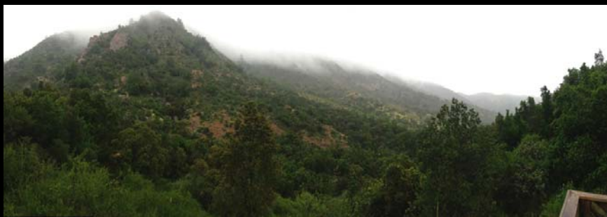
1. Portada. Ruta exploratoria Dé_Tour [etnografía y derivas] sector Cajón Grande la Campana, Primavera 2017.